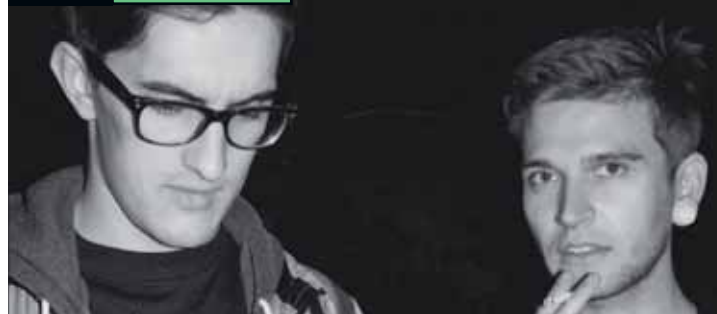
Elektronische DJs, aber trotzdem gut angezogen