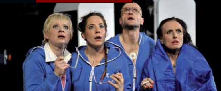
„Das Ministerium“