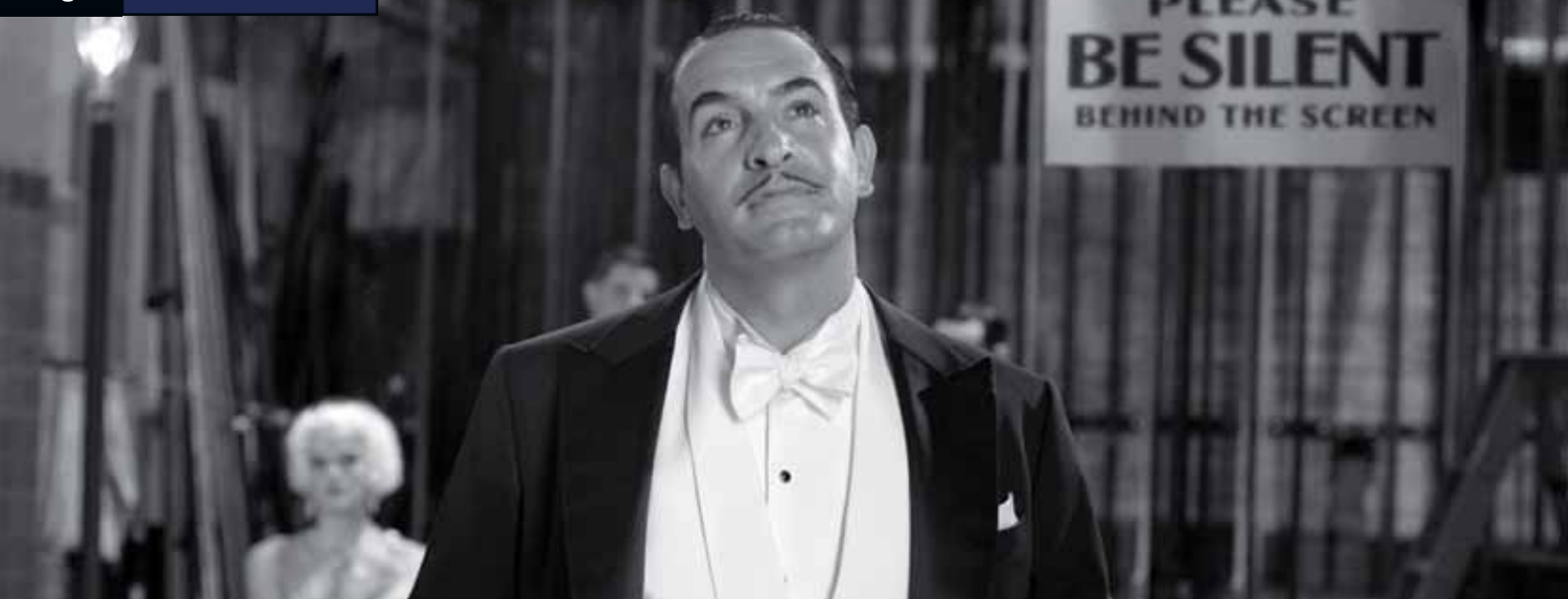
Seine Welt gerät ins Wanken: Stummfilmstar George Valentin (Jean Dujardin)