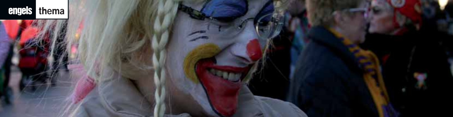
Nachdenkliche Närrin in Wuppertal