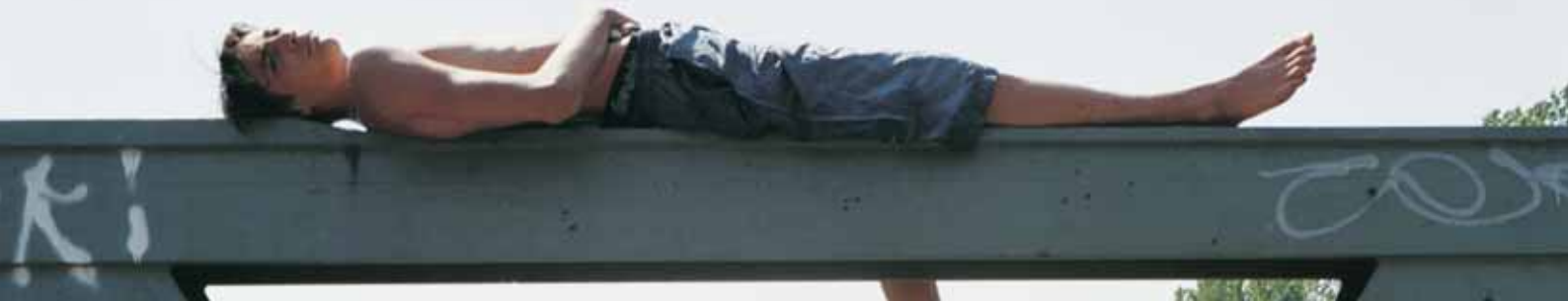
Junge am Kanal