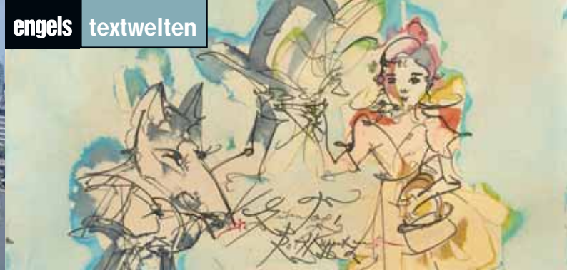
Aus „Es war einmal ...“, Illustration: Albert Schindehütte