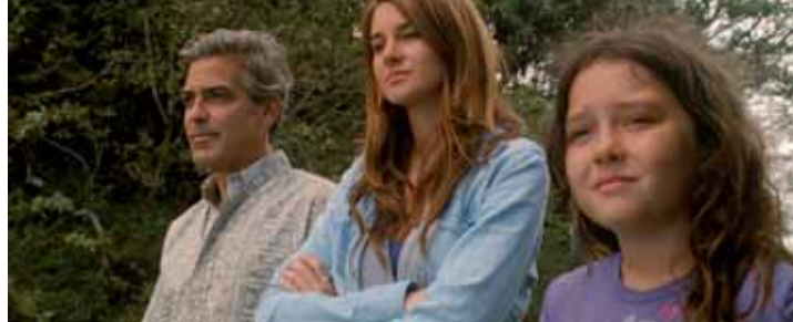
Familiendrama ohne Sentimentalitäten: George Clooney mit seinen Filmtöchtern