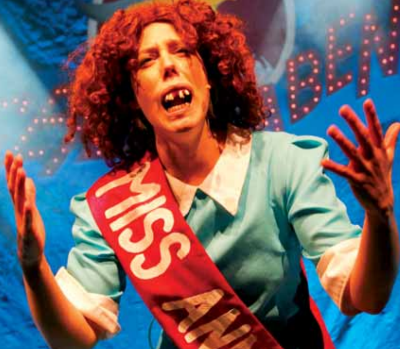
Manchmal ist Karneval kein zahnlöser Tiger