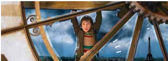
Kindergeschichte als Filmspektakel: Asa Butterfield als Hugo Cabret