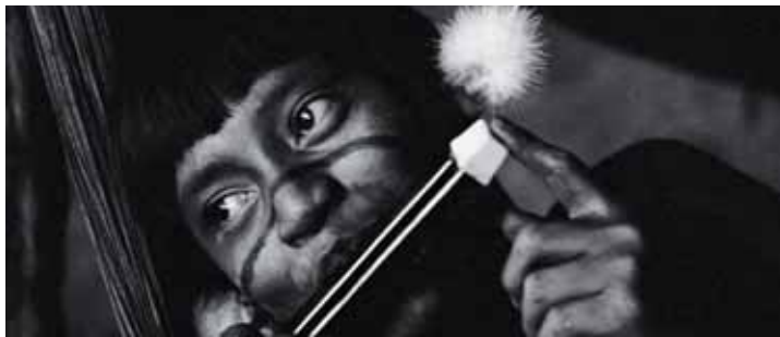
Sammlung Baumgarten/Sugai im Museum Folkwang: Yanomami Ethnographica, Angehöriger der Yanomami, 1978/79, © Foto: L. Baumgarten