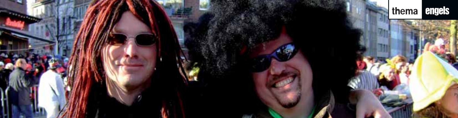
An den Haaren herbeigezogene Pointen