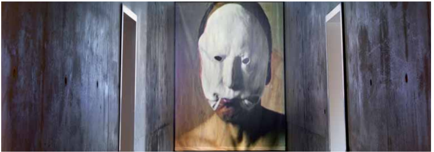
Daniel Pešta, Narziss, 2010, © D. Pešta, courtesy Kunstmuseum Solingen