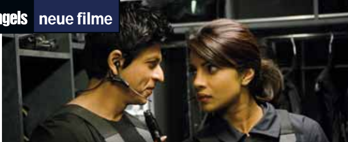
Der Gentleman-Gangster in Aktion