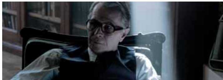
Old School-Oldman: Gary Oldman als George Smiley