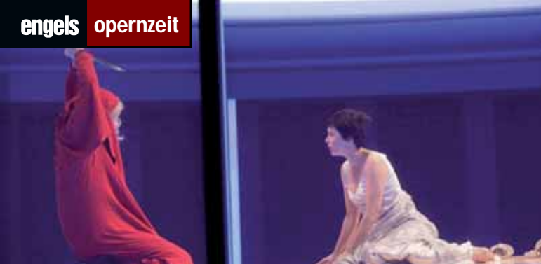
Kölner Probenfoto der Monteverdi-Oper „L'incoronazione di Poppea“, Foto: Paul Leclair