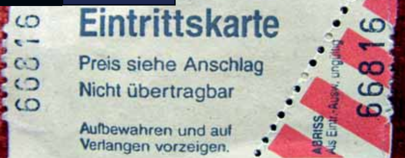
Warner konnte 2011 die meisten Tickets absetzen