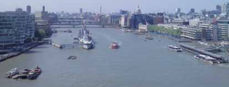
Die Themse wohnt mietfrei mitten in London, die Sau