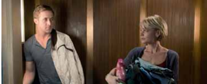
Der Film schwebt, wenn Ryan Gosling auf Carey Mulligan trifft