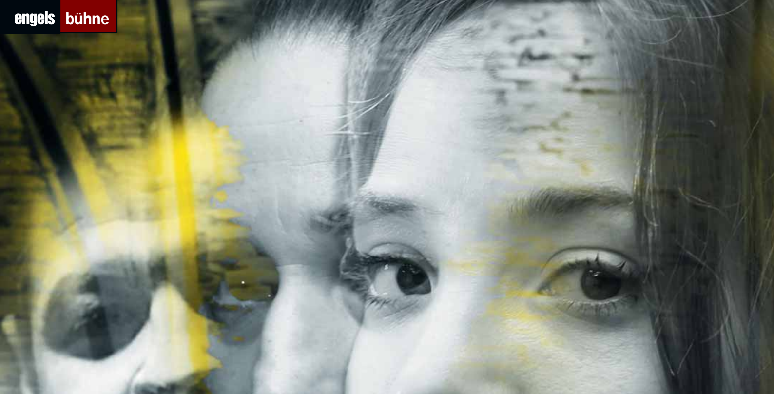
Der schöne Traum ist ausgeträumt und mündet in bittere Desillusion