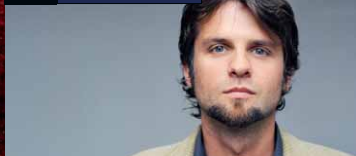
Regisseur Hans Weingartner