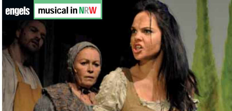
„Der Mann von La Mancha“ in Aachen