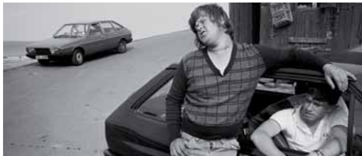
Chris Killip, Bever, Skinningrove, Yorkshire, 1980