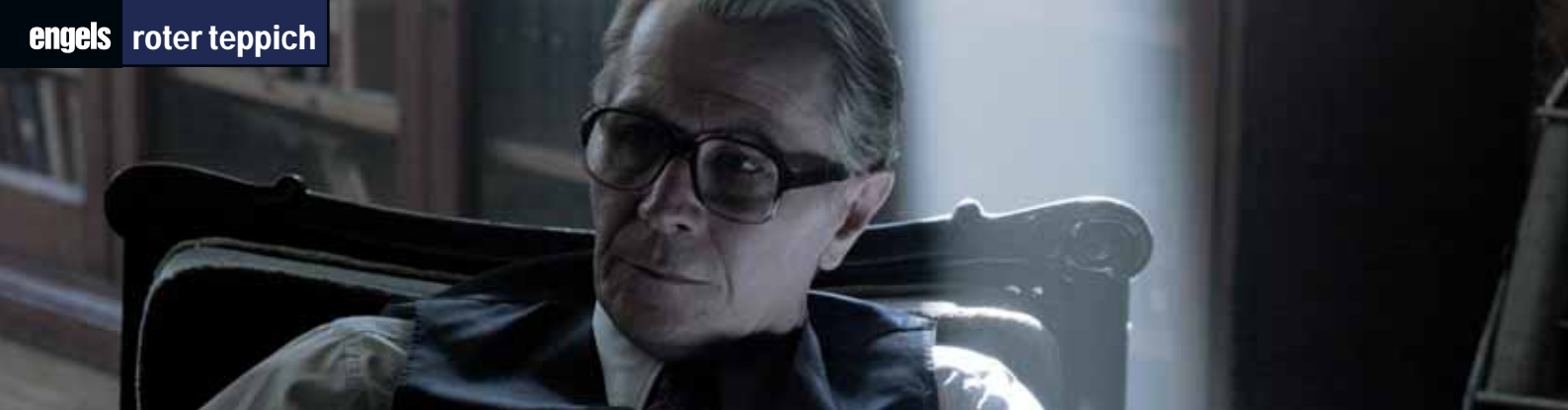
Wo Licht ist, ist auch Schatten: Gary Oldman als George Smiley in „Dame, König, As, Spion“